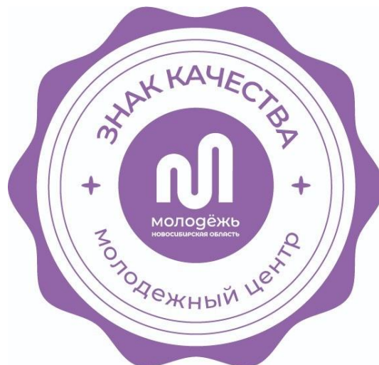
Рис. 1. Эмблема «Знак качества»

Эмблема может быть исполнена в монохромном оформлении по запросу организации-победителя, основанном на фирменном стиле организации и цветовой палитре оформления фасада здания (Рис.2)