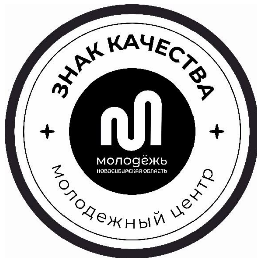
Рис. 2. Эмблема «Знак качества» в монохромном оформлении